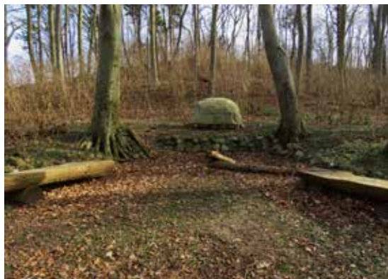
En mindesten fortæller, at Fredsbjerg blev skænket Bagenkop i 1920 af lensgreve Frederik Ahlefeldt-Lauvig. I dag ejes bakken af Langeland Kommune.

Bagenkop er en hyggelig fisker- og ferieby med flere spisesteder, en kro, en campingplads, en god badestrand og fine ferieboliger. Hvis du følger ildsjæle-sporet og bruger de opsatte QR-koder, får du en masse at vide om Bagenkops historie.