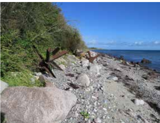
"Tjekkiske pindsvin" på stranden ved Føllesbjerg.