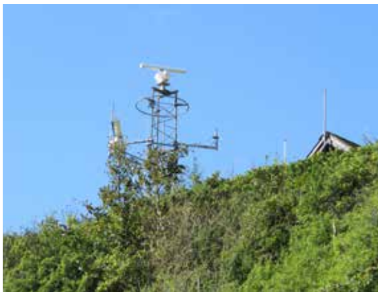
Udkigsstation Føllesbjerg set fra stranden.