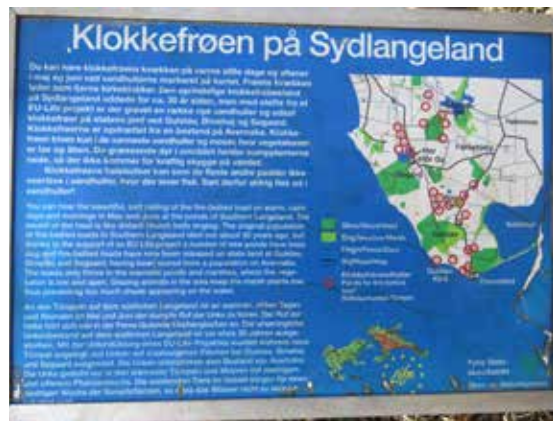
På Langelands sydspids har klokkefrøer kronede dage i en stribe vandhuller gravet specielt til dem.