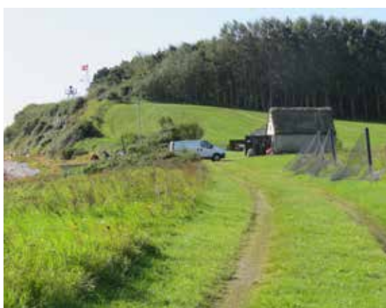
Fiskere (øverst) og deres garnhus for enden af Strandvej.