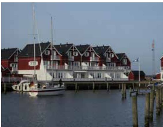
Tv: Fra fiskekutteren "Liljen" i Bagenkop Havn sælges friske fisk.