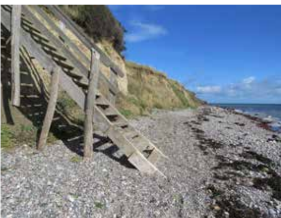
Trappe fra stranden op i Lunden.