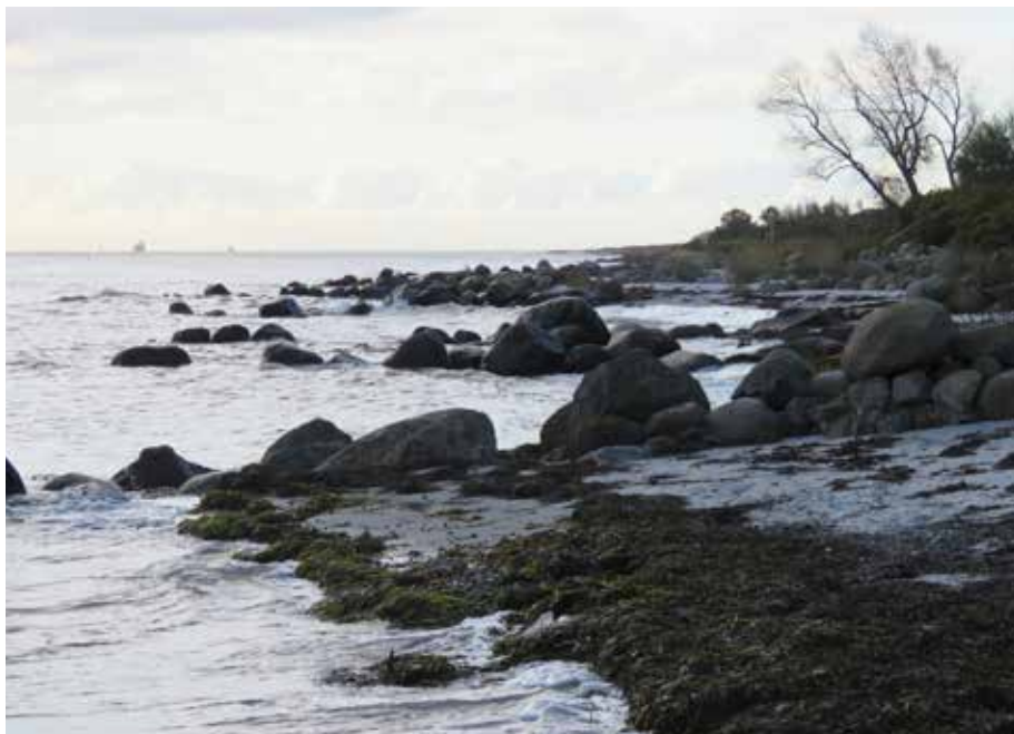
I Lunden tæt på øens sydspids kan du overnatte i telt - og nyde udsigten.

LANGELAND RUNDT En vandretur på 139 km 10 etaper a 10-19 km