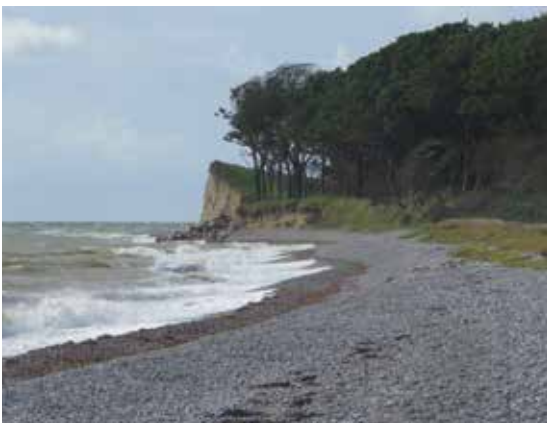
Skoven Østre Gulstav (Østerskov) og Dovns Klint.