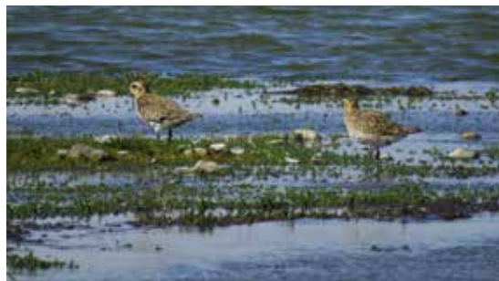
Fugle ved Keldsnor.