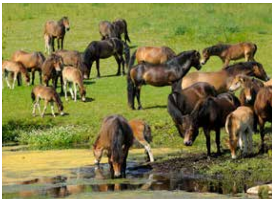
De vilde heste er ikke særligt vilde, men meget smukke.

fine kig ud over Sydlangeland og farvandet omkring.