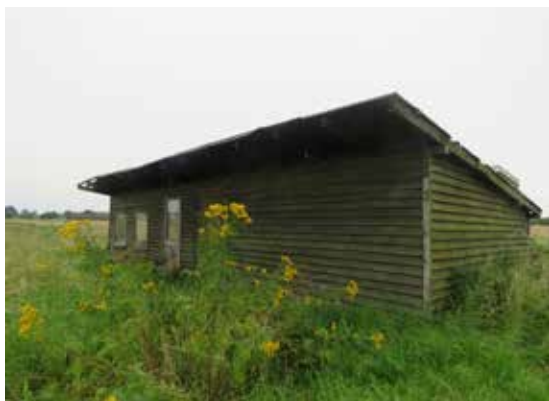
Skydeanlæg for enden af Bøsseløkkevej. Alting er i forfald, og ingen øver sig længere i at skyde her.

12. Forfalden skydebane. Lige syd for Bovballe Skov ender Bøsseløkkevej ved kysten.