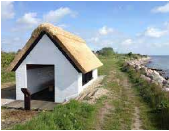
Renoveret garnhus/madpakkehus ved Østerskov/Bukkemose.

11. Garnhuset ved Østerskov. Etape 2 starter, hvor Østerskovvej ender ved kysten. Her ligger en primitiv lejrplads, som tilhører og vedligeholdes af ejerne af Østerskovvej 42, og et renoveret garnhus, et minde fra tiden mellem Første og Anden Verdenskrig, da der blev drevet fiskeri fra kysten her. I huset er man velkommen til at spise sin madpakke, og plancher fortæller om datidens fiskerhuse og kystfiskeri.