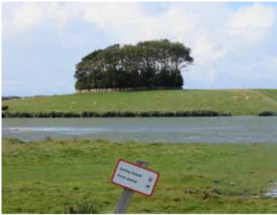
Skiltet fortæller, at gravhøjen på marken er privat.