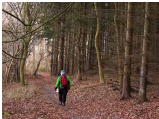
På Øhavsstien gennem Faarevejle Skov.

Følg Øhavsstien resten af vejen til Rudkøbing, den er fint skiltet: Først går du ca. 100 meter nordpå ad Faarevejle Allé, så ind gennem Horsehave, videre ad Kragholmvej og forbi Rudkøbing Rensningsanlæg til kysten. Så har du ca. en kilometer tilbage, før du via en lille sandstrand når i Rudkøbing.