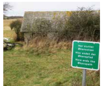
Her slutter Øhavsstien...