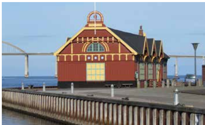
Det maritime pakhus.