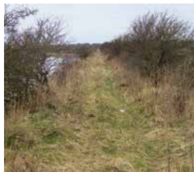
Dæmningen er cirka 800 m lang.