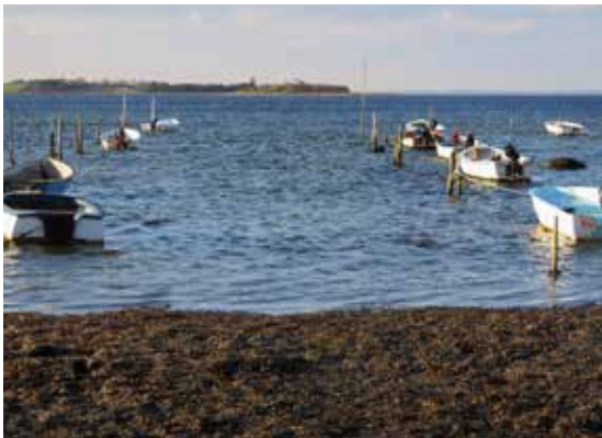
Jollehavnen for enden af Klæsøvej.

Men du er nu ganske rigtigt på Øhavsstien, den 220 km lange vandrute, som fører hele vejen rundt om Det Sydfynske Øhav. Følg Øhavsstien nordpå til Faarevejle Gods.