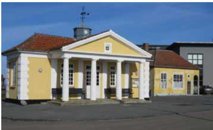
Ventesalen ved Strynø- og Marstal-færgernes lejer.