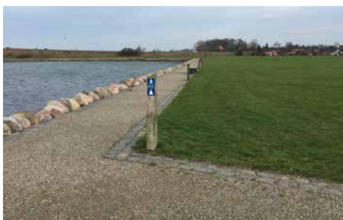
Øhavsstien går ud under Langelandsbroen og tilbage igen på den anden side.