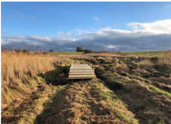
Spang (bro) på stien "Søstenen".