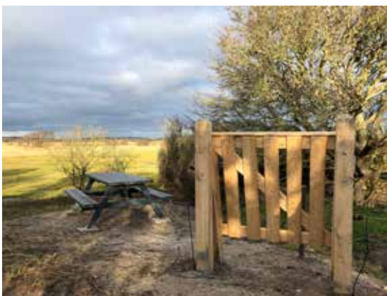
Bord og bænke ved den østlige ende af dæmningen mellem det tørlagte Henninge Nor og Lindelse Nor.