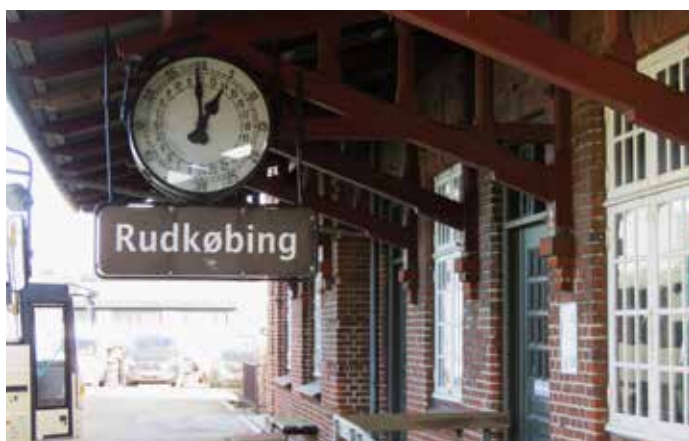
24-timers-uret på Rudkøbing Station (tidligere banegård).