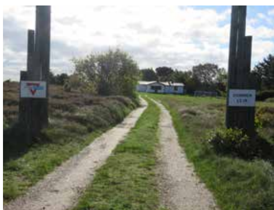
Havgårdsvej følger kysten til KFUM og KFUKs sommerlejr.

4. Næbbevej. Fortsæt langs kysten og Havgaard Skov. Hvis du bliver træt af at trave i det løse sand på stranden, så gå op på markvejen Havgårdsvej, som går parallelt med kysten frem til KFUM og KFUKs sommerlejr, som ligger for enden af vejen. Gå tilbage til stranden.