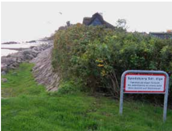
Skilt ved Spodsbjerg Søndre Dige – adgang forbudt!

Gå videre ad stranden sydpå, nogle kampestenhøfder kommer på tværs, men kan mageligt forceres. Gå forbi det åbne fællesareal ved sommerhusområdet Spodsbjerg Drej.