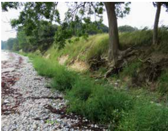
Kysten syd for Skovsgaard.

Når du har studeret mindestenen, gå tilbage til kysten og kravl ned ad den lidt stejle skrænt (ler og store sten) til stranden. Følg vandkanten på sand/rullesten.