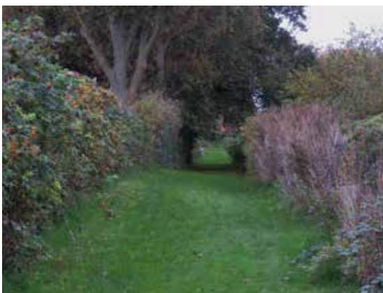
Sti fra stranden til vejen Drejet.

Alternativ (stiplet streg på kortet): Følg kysten sydpå. Cirka 700 meter nede ad kysten løber Tudserenden ud i Langelandsbælt, og udløbet kan være svært og risikabelt at krydse. Men har du mod på at smide bukserne, evt. svømme over eller uden om udløbet, fortsætter du på den anden side af renden mod syd forbi ejendommen Næbbevej 7 og følger Næbbevej, til du igen kan komme ned på stranden.