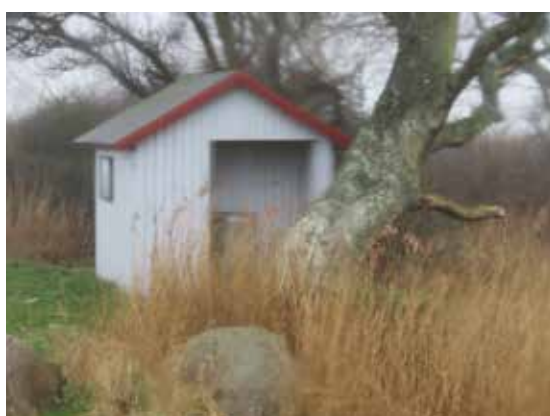
Toilet ved Kågårdsvej/Påøvej.

Fortsæt sydpå ad stranden eller Påøvej – flere bord-bænkesæt og fin badestrand – eller besøg Skovsgaard Gods.