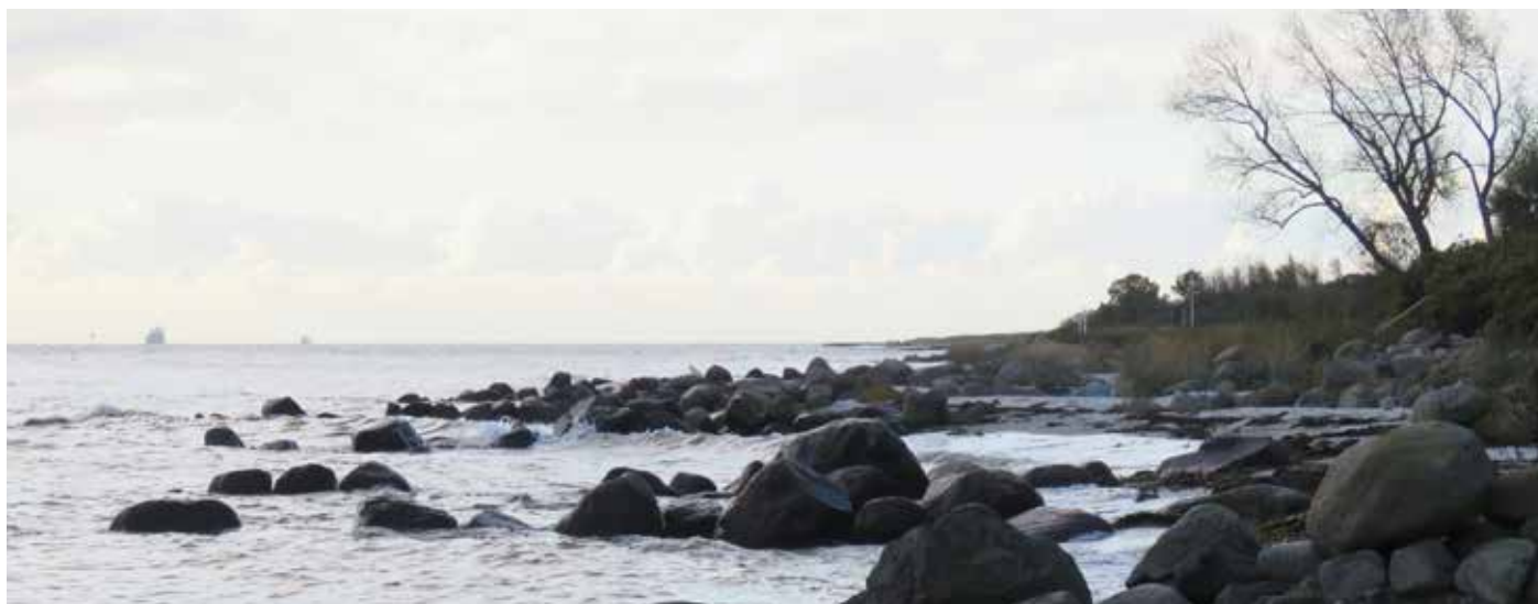
Høfder syd for Spodsbjerg.