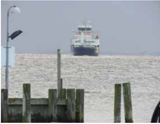
Færgen fra Lolland på vej i havn i Spodsbjerg.

1. Færgelejet i Spodsbjerg. Øhavsstien mellem Lohals og Rudkøbing har en lille afstikker til Spodsbjerg. Afstikkeren slutter lige nord for færgelejet i Spodsbjerg, her er p-plads, og her begynder vores vandretur mod syd Langeland rundt.