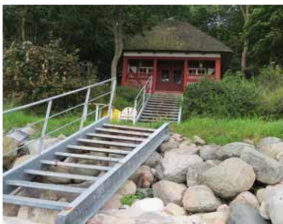
Meget fint badehus med en solid trappe til stranden.

Et par kilometer videre mod syd ligger sommerhusområdet Bukkemose. Langs sommerhusområdet går fine stier, og her findes bord-bænkesæt, grillplads, parkering og legeplads. Ved sommerhusområdet er etableret en solid badebro, og for enden af Slåvænget ligger en offentlig toiletbygning og et slæbested med en handicapkran (til at løfte handicappede ned i en båd).