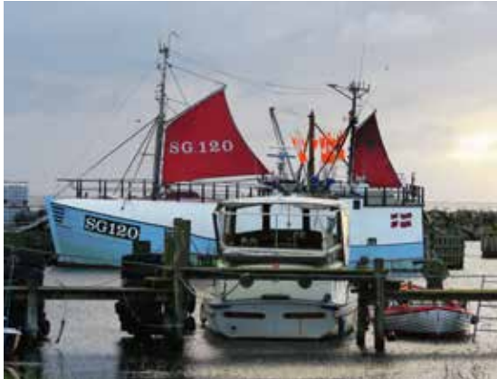
Fiskekutter i Spodsbjerg.

Lystbådehavnen Spodsbjerg Turistbådehavn har legeplads, grill og overdækket bord-bænkesæt.