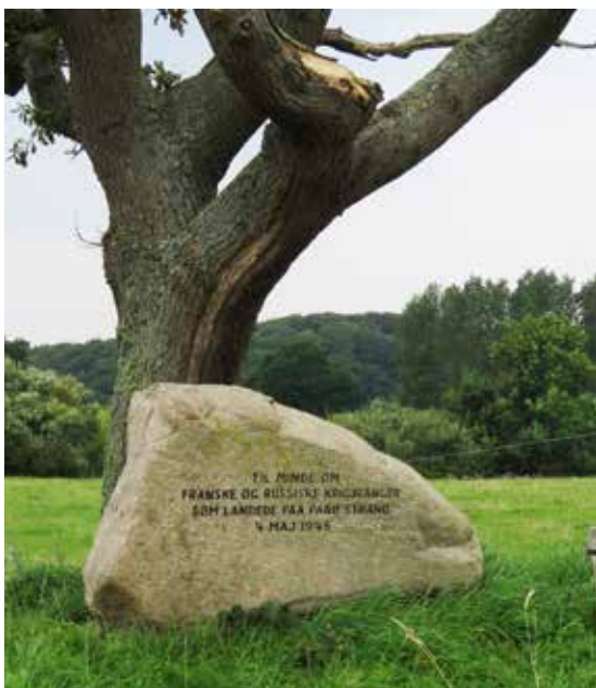
Inskription: "TIL MINDE OM FRANSKE OG RUSSISKE KRIGSFANGER, SOM LANDEDE PAA PAAØ STRAND 4 MAJ 1945"