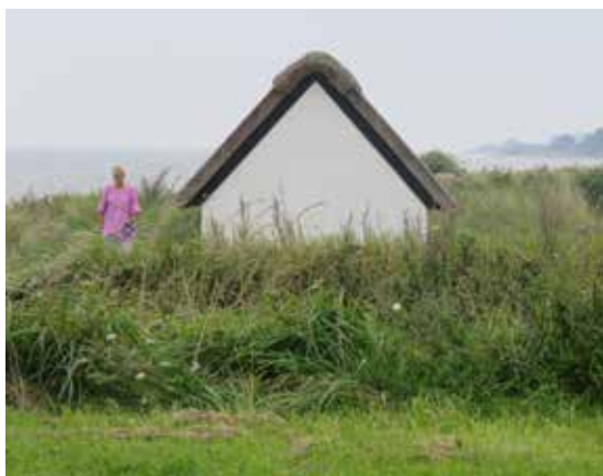
Renoveret garnhus ved Østerskov/Bukkemose. Herinde må du gerne spise din madpakke.

Her ligger også - lige syd for enden af Østerskovvej - en primitiv lejrplads, som tilhører og vedligeholdes af ejerne af Østerskovvej 42.