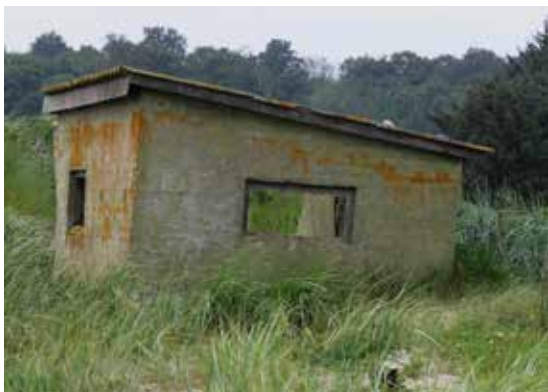
Faldefærdigt skur - mon det står endnu?

10. Smukt badehus. I den lille skov Eskebjerg Have ligger synligt fra stranden og for enden af en skovvej et privatejet, nysseligt, gammelt badehus med rødmalet bindingsværk, stråtag og en imponerende galvaniseret trappe. Offentligheden har ikke adgang til huset, men du må gerne tage en dukkert fra den lille sandbadestrand.